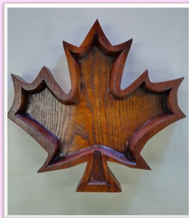
お盆 「メイプルリーフ」 Aブロック展：佳作 (松島 陸)