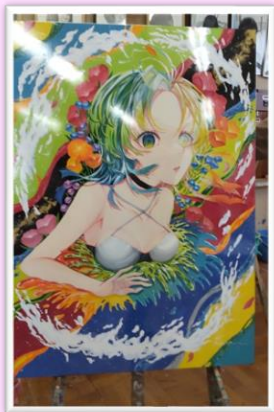
デザイン 「色彩」 芸文祭：入選 (井原帆華)